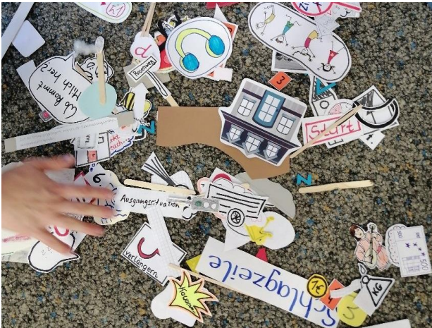
Zubehör für den Legefilm.

Ein Legefilm lässt sich vielseitig einsetzen: Zum Beispiel zur Vorstellung eines Buches, aber auch sehr gut zum Erklären von Sachverhalten. Für Legefilme in 2-D müssen keine Kulissen gebaut werden. Die Kamera (Tablet) filmt von oben einen kleinen Bereich einer Unterlage (Tisch, Fußboden, Unterseite einer Box). Dafür wird das Tablet an einem Stativ befestigt. Es ist auch möglich, einen Pappkarton oder eine Kunststoffbox auf die Seite zu stellen und ein Tablet auf die obere Kartonseite zu legen. Die Kamera filmt dann durch ein extra dafür angefertigtes Loch die Unterseite der Box. Wichtig ist natürlich, dass der Bildausschnitt passt und die Beleuchtung stimmt.