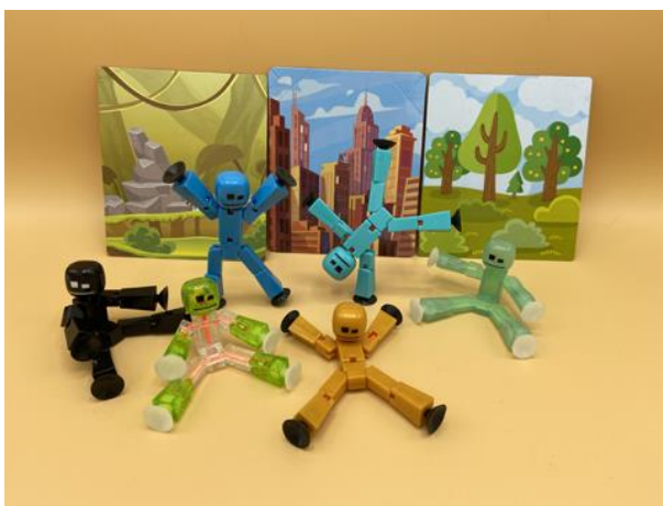
Stickbotfiguren liegen der Box bei

Auch in solch kleinen Geschichten steckt bereits einiges an nicht zu unterschätzendem Arbeitsaufwand. Storyboard, Hintergründe, Kulissen, Figuren, ... - alles muss gemalt, gebastelt und zusammengesucht werden. Es ist empfehlenswert, wenn jedem Teilnehmer in jeder Phase der Filmproduktion eine Rolle zugewiesen wird, damit immer alle beschäftigt sind und sich niemand langweilt.