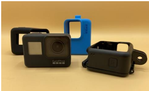
Foto GoPro und Schutzhüllen

Um die GoPro mit dem Zusatzmaterial zu verbinden, gibt es verschiedene Schutzhüllen und „Schrauben“. Eine Auflistung der Verbindungsmöglichkeiten finden Sie im Anhang an dieses Dokument.