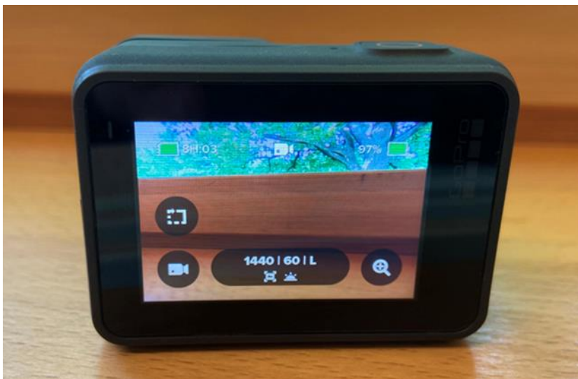
Touchbildschirm der GoPro

Die eingeschaltete GoPro wird über den Touchbildschirm bedient und gesteuert. Im Startbildschirm passen Sie Videoeinstellungen, Zoom und Kurzvideos an.