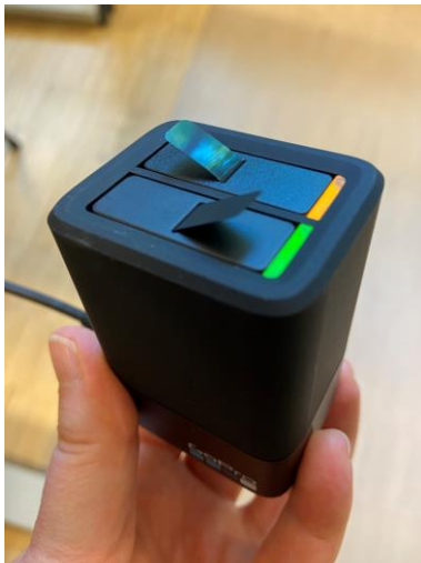
Ladegerät (Dual Battery Charger)

Die GoPro-Akkus können über das beiliegende Ladegerät (Dual Battery Charger) aufgeladen werden. Auf der Unterseite befindet sich das Fach für den Akku und die Speicherkarte (256 GB). Der Akku kann mit Hilfe des kleinen schwarzen Bändchens herausgezogen und in das Ladegerät gesteckt werden. Mit dem zusätzlichen Akku können auch während der Ladezeit weitere Aufnahmen gemacht werden.