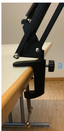
Aufbau Stativ Tischklemme