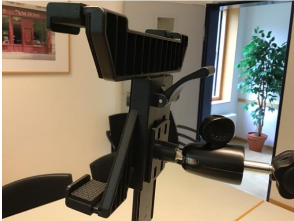
Aufbau Stativ Haltewinkel