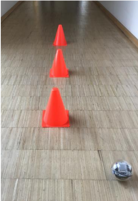
Beispielaufstellung Kegel-Parcours (individuell veränderbar)

Für den Beispiel-Parcours stellen Sie drei Kegel auf und versuchen, den Sphero Bolt so zu programmieren, dass er durch alle Lücken fährt, ohne die Kegel zu verschieben.