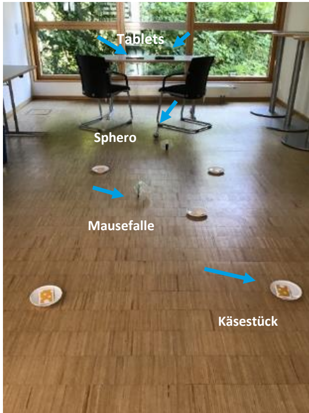
Vorschlag Spielaufbau „Blinde Mäuse“ (individuell veränderbar)

Ziel des Spiels ist es, dass ein Team zuerst zwei oder mehr Stücke Käse erhält, indem es mit dem Sphero den Teller trifft. Schwierig wird es durch die Mausefalle(n), die beliebig auf der Spielfläche platziert ist / sind.