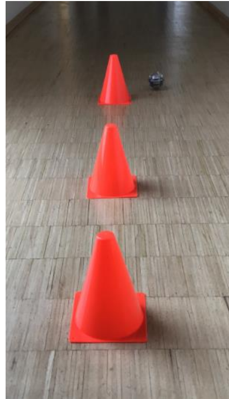
Kegel-Parcours nach Durchlauf der Programmierung