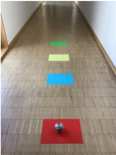
Aufbau „Farben programmieren“ in gerader Linie

Ein erstes einfaches Beispiel zur Programmierung von Farben und Tönen (Textansage durch das mobile Endgerät) funktioniert folgendermaßen: Sie legen vier Blätter in verschiedenen Farben aus. Die Kinder sollen den Sphero so programmieren, dass er von einer Farbe zur nächsten fährt, dort die Farbe ansagt und zum Schluss stehenbleibt.